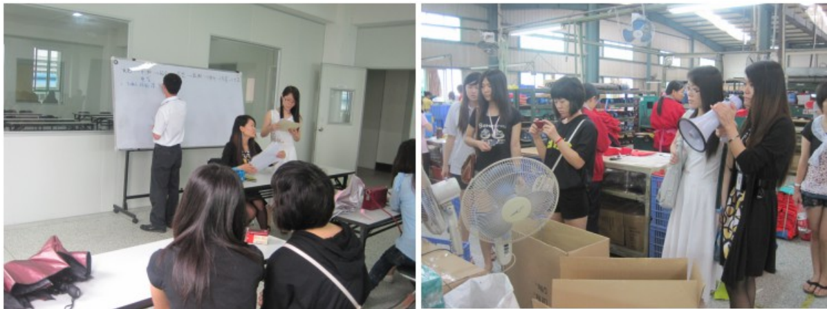
图1 校外实践基地现场教学