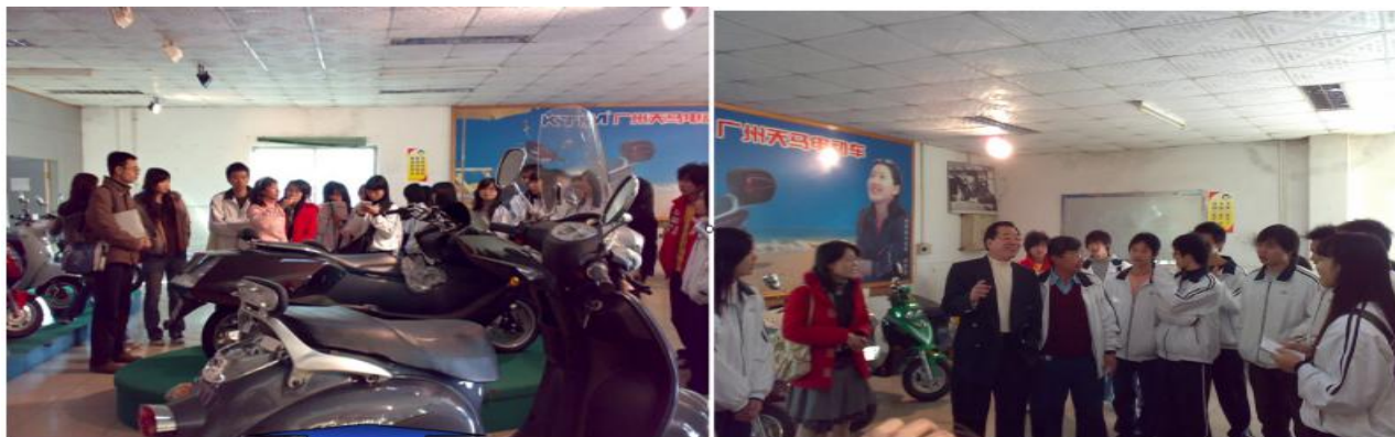
图 16 广州天马公司现场教学

2. “走出去”：组织学生到企业、工业园区等进行参观实习或现场教学（图 16-18），让学生感受真实工作岗位的工作要求，为今后就业做好“热身”准备。