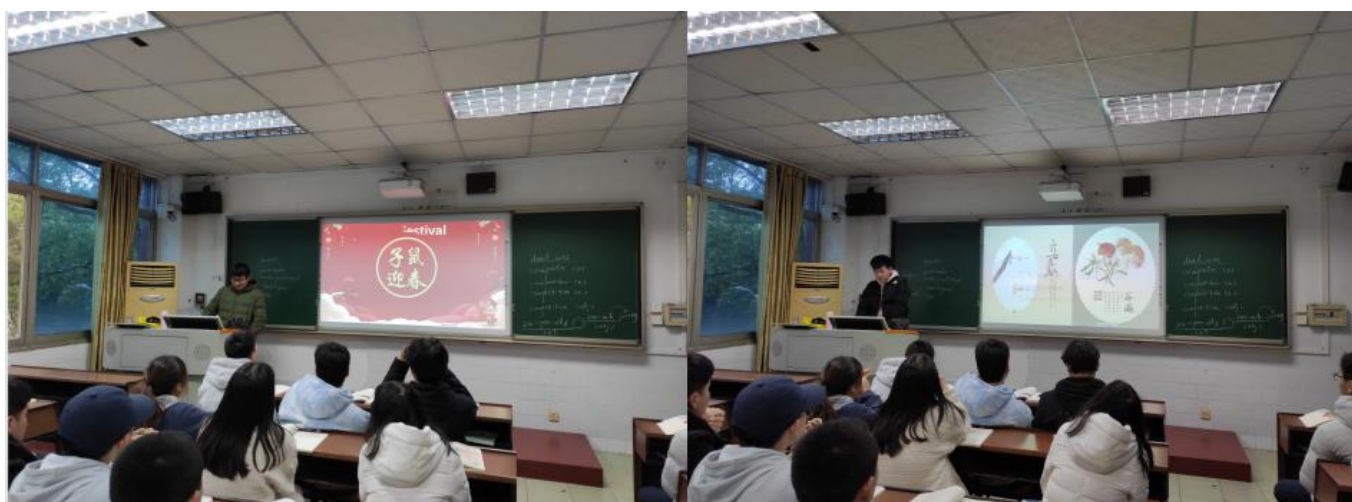
图2 学生对中国传统文化的英语作品分享（史小平）