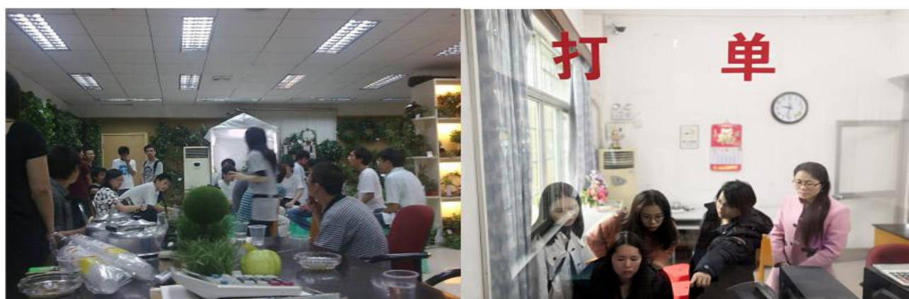
图 18 东俊公司和报关公司现场教学