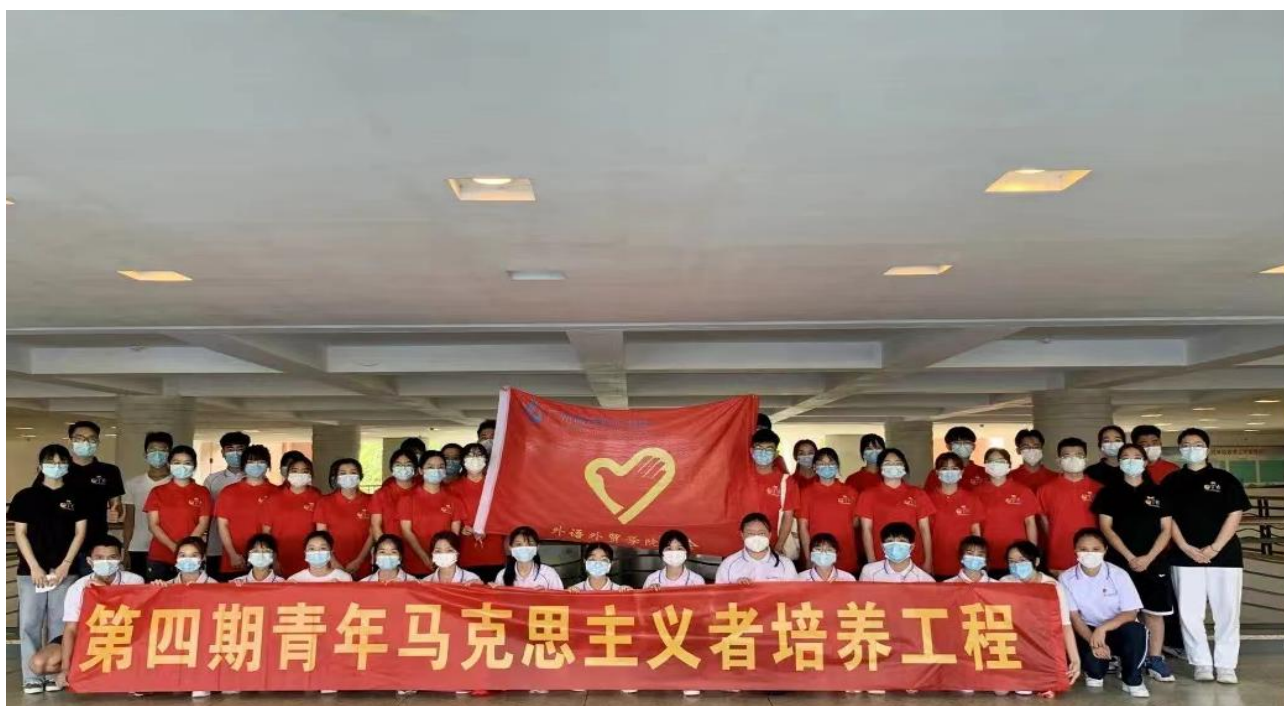
图6 参加“马克思主义培养工程”