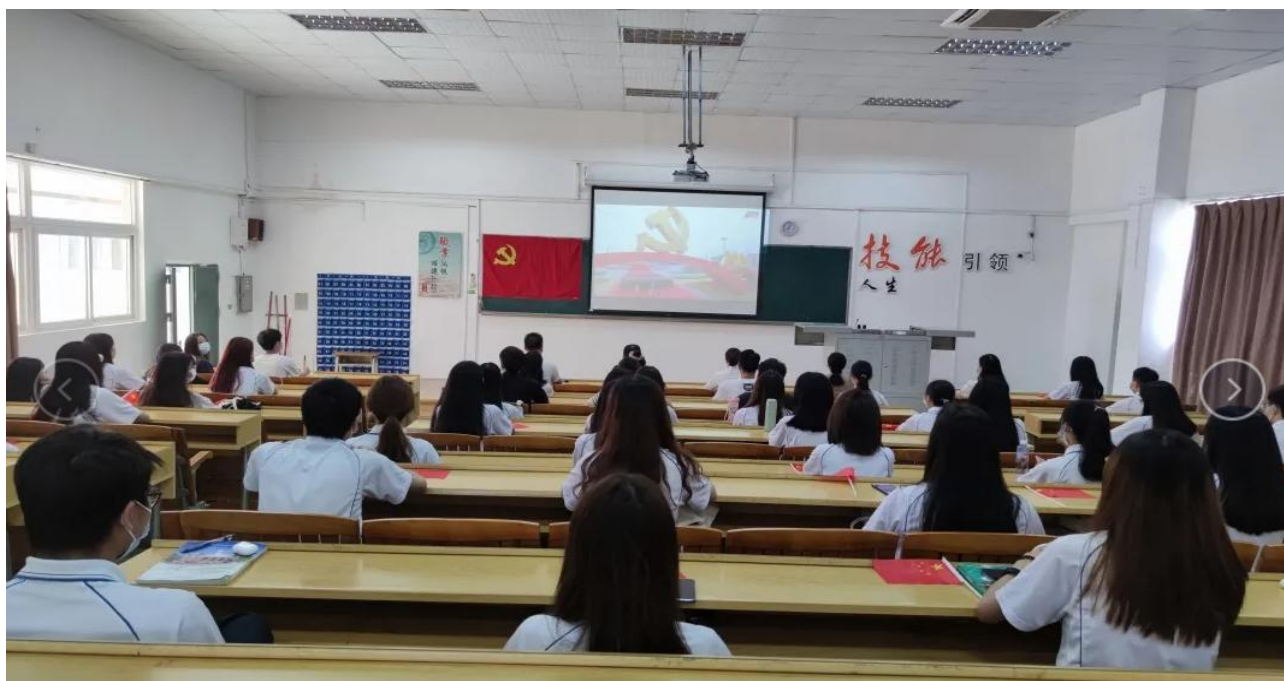
图 8 组织学生观看“中国共产党成立 100 周年大会”直播视频