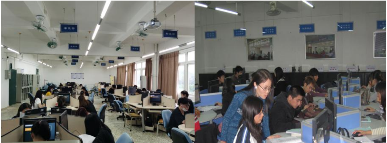
图 11 根据企业工作场景建设校内实训室文化