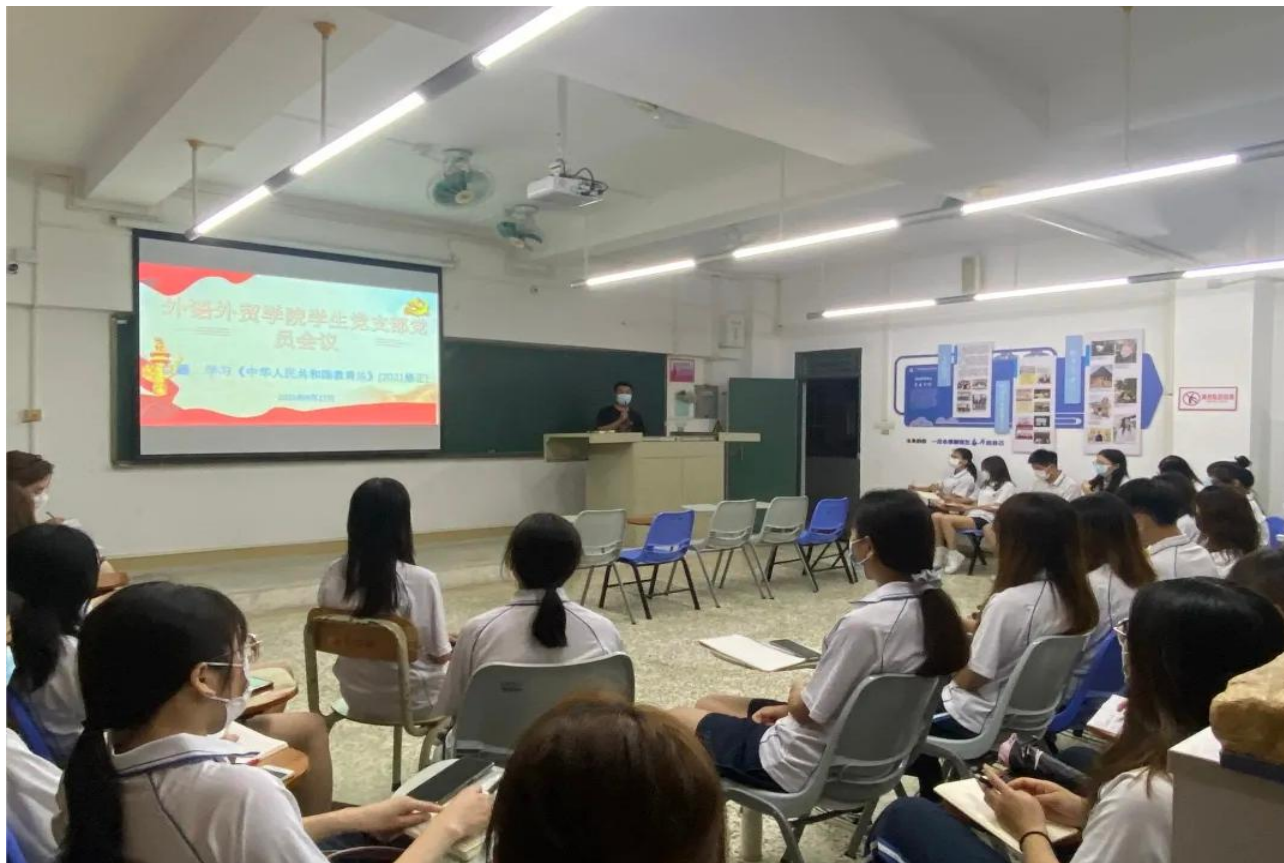
图5 “三会一课” 主题学习