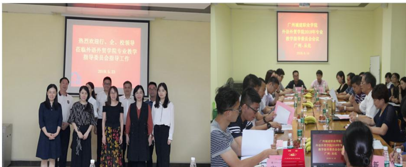
图 13 校企共建专业教学指导委员会共商人才培养方案和有关管理制度

的基础；另一方面，引进企业先进的管理制度和管理理念，尤其是学生在实训过程和学习成绩考核中，可以借鉴企业“绩效考核制度”、“PDCA 循环质量管理”、“责任目标管理”等先进的管理制度与管理方法，引入企业的计划、竞争、奖惩等管理机制，以规范校园的制度文化体系和学生的学习行为习惯，提高学生的竞争意识，让学生逐步了解企业的制度文化，培养学生良好的职业素养。