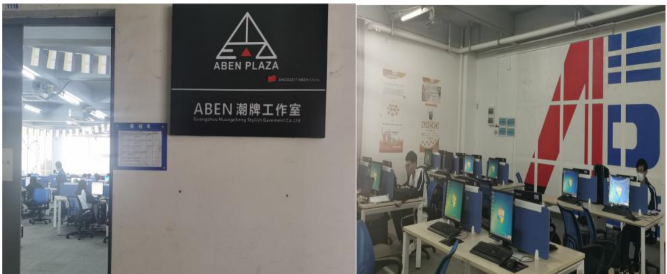
图 12 引企入校，将企业文化引进校内实训室