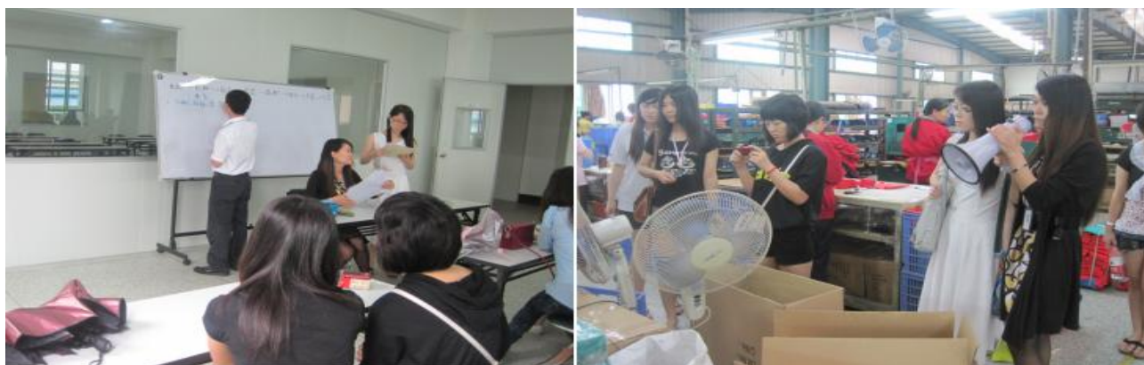
图 17 福廷威公司现场教学