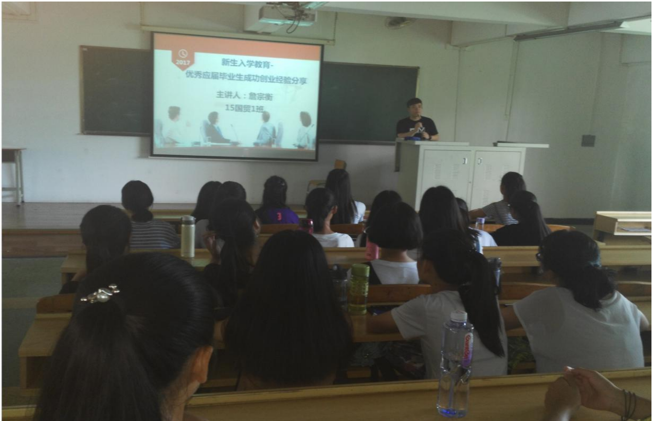
图 14 优秀毕业生创业经验分享