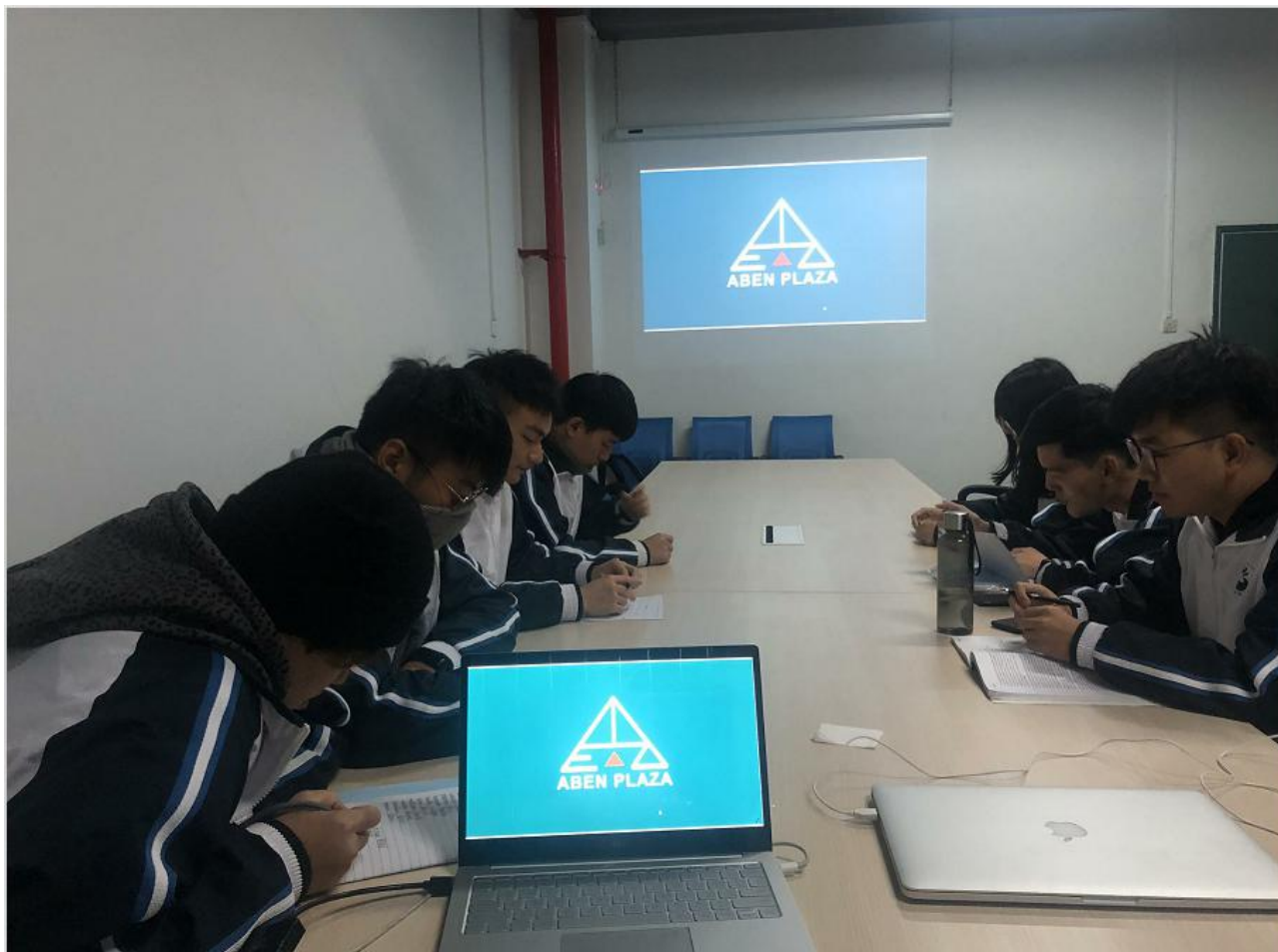
图 19 联合校外实训基地在校内创办“潮牌工作室”并开展各种创新创业活动

3. “联手干”：学校与企业联合开展各种专业技能竞赛、创新创业活动（见图 19），将创新意识、竞争意识、市场意识等文化内涵融入竞赛和创新创业活动过程，提升学生职业素养与实操能力。