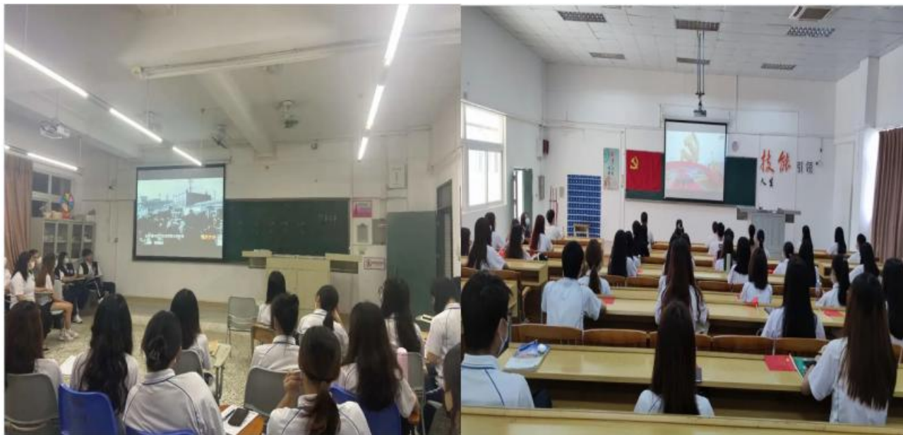
图 7 组织学生观看“铭记九一八”视频和“1921”电影