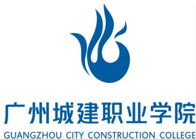
图 21 我校凤凰雕塑与校徽