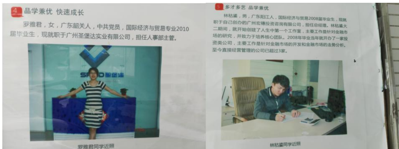
图 9 创业学院宣传栏上优秀毕业生事迹

物质文化是学校开展教科研活动的物质条件，是校园文化最直接的表现形式与存在基础，也是最容易融入企业文化的切入点。例如，在教学楼教室内、楼道、文化墙、文化走廊、图书馆等地方悬挂优秀毕业生和创业成功校友的先进事迹（见图 9）和著名企业家的座右铭或成功语录（见图 10），让优质的企业文化，潜移默化地走进学生心里，做到润物细无声的德育效果；同时，根据企业真实工作场景布置实训室、实训中心环境，并根据其所对应的行业和岗位要求，悬挂有关职业标准、工作流程、工作要求，在展示柜展示有关生产原料、产品、生产模具和生产工具等让学生进入实训场所犹如进入工作场所，让学生有种身临其境的感觉，并在实训过程中提前感受到浓浓企业文化氛围，为今后就业打下良好的基础（见图 11-12）。