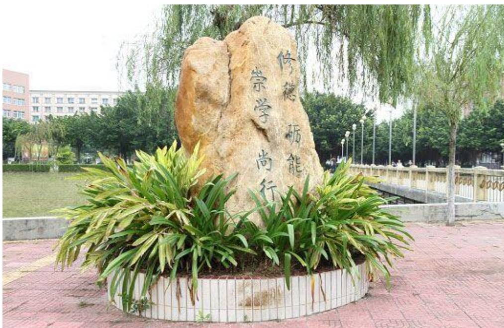
图 20 我校校训“修德、砺能、崇学、尚行”

诚实守信、团结进取的职业素养。此外，还可以将内隐的精神文化进行外显建设，例如学校的大楼名称、道路、宣传画、雕塑等，都可以展现社会主义先进文化与学校的精神文化，使校园春风化雨、处处育人。例如我校的凤凰雕塑与校徽象征着我校精神文化（图 20），校徽设计因位于凤凰山下、凤凰河畔，凤凰寓意学校历经沧桑、迅速崛起的发展历程，寓意学校光明远大的发展前景，凤凰的执着精神也与城建精神相吻合。