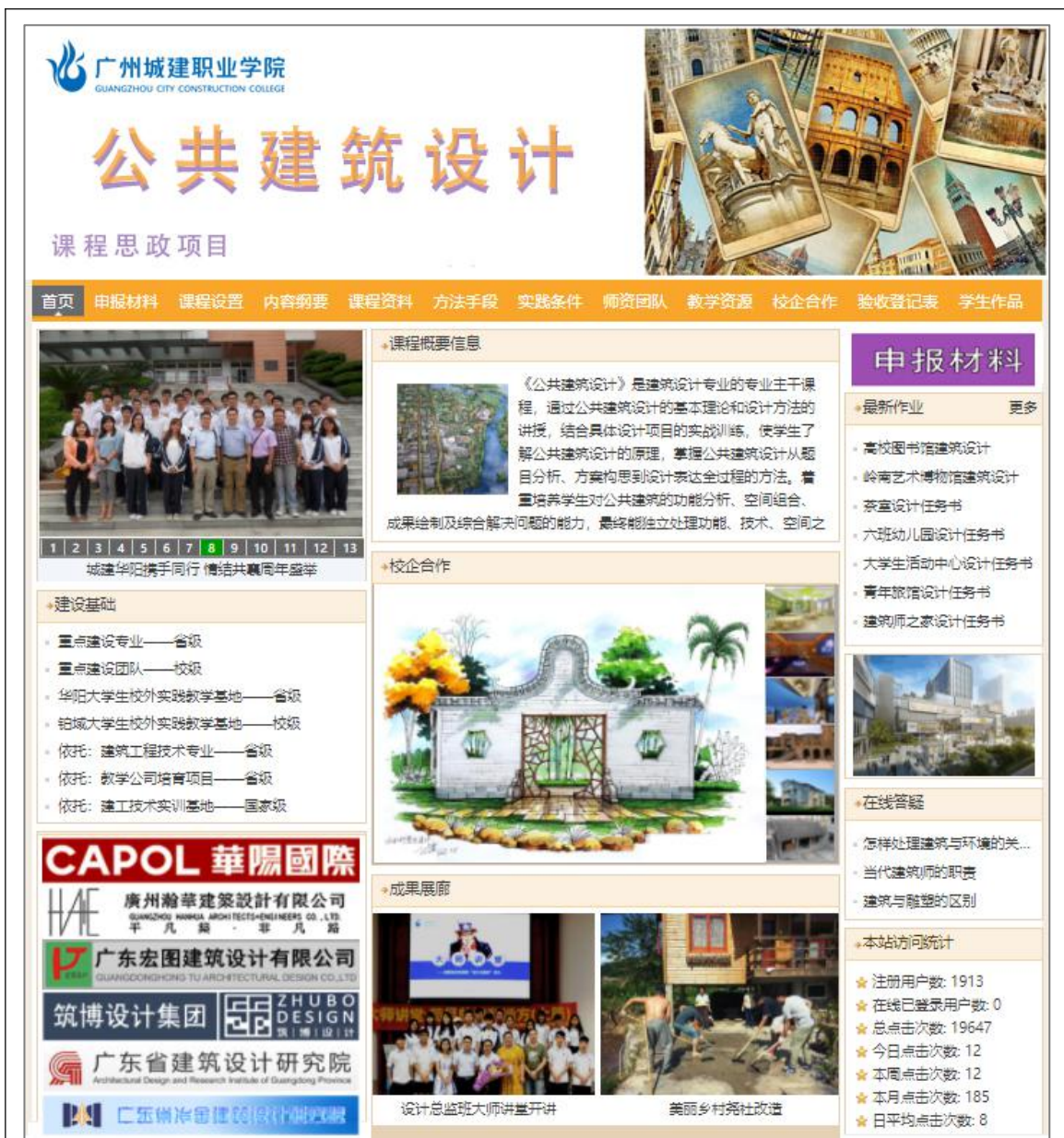
图2 公共建筑设计课程精品资源共享课程网站截图

项目团队人员结构合理，专兼结合。包括建筑行业企业的业界龙头单位，信息技术公司技术人员等。广州华阳国际设计集团、广东宏图建筑设计有限公司、广州铂域建筑设计有限公司、广州本筑信息科技有限公司、广州库塔建筑工程公司等，具有行业企业龙头地位，均与本专业开展了多年的校企合作，积极参与人才培养、课程建设、校企合作，具有保证项目顺利进行的强大实力。