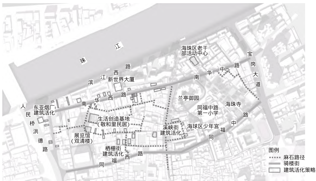
图2 南华西街历史文化街区物质要素保护示意

色,对绿化环境较差的街道,在保护历史建筑的前提下,结合少量风貌和质量均较差的建筑的更新与整治,沿街增设绿化和小规模的广场。