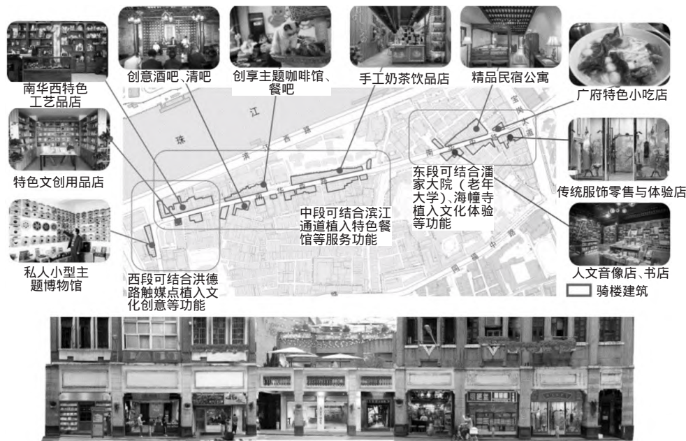
图3 南华西街历史文化街区骑楼产业植入效果