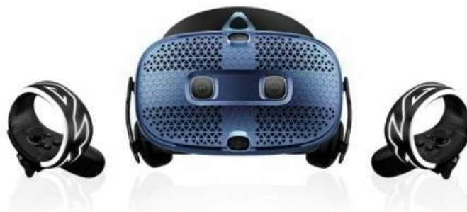
(3) 全沉浸式头戴式显示器

VR 教学一体机设备具备科技感极强的设计，配合 VR 头盔可以进行行走体验。可以在此设备内实现虚拟学前教育场景漫游等 VR 实训练习。