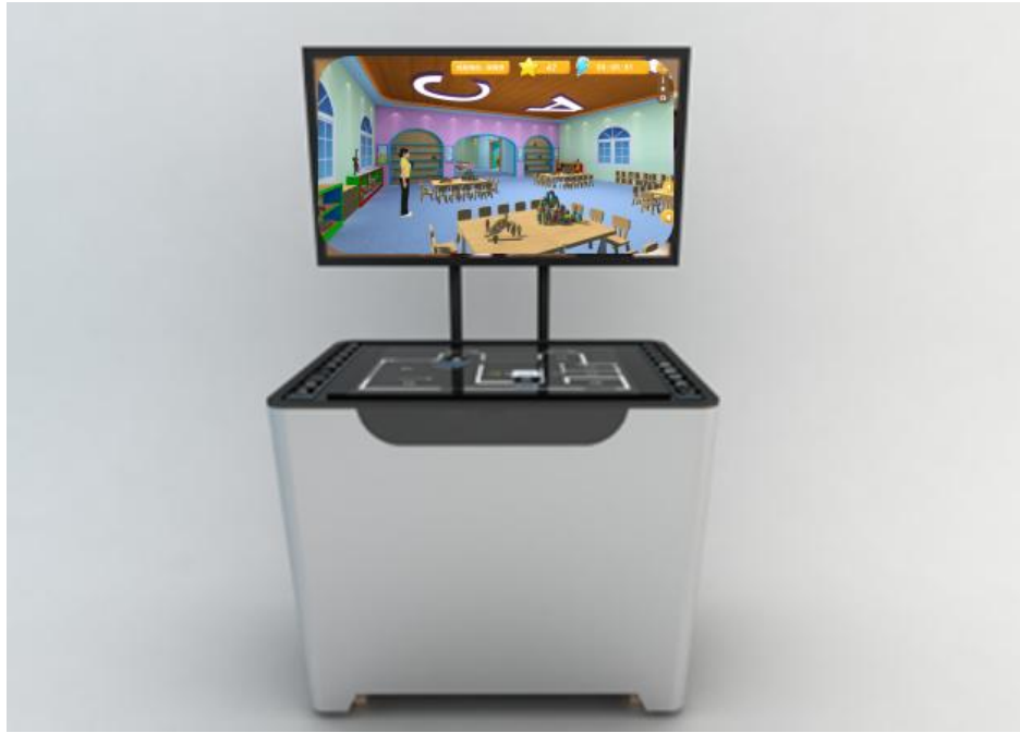
(2) VR 教学一体机