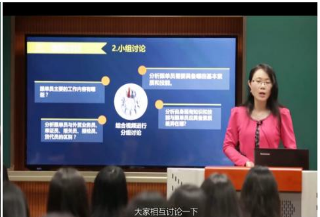
图 6 小组研讨问题