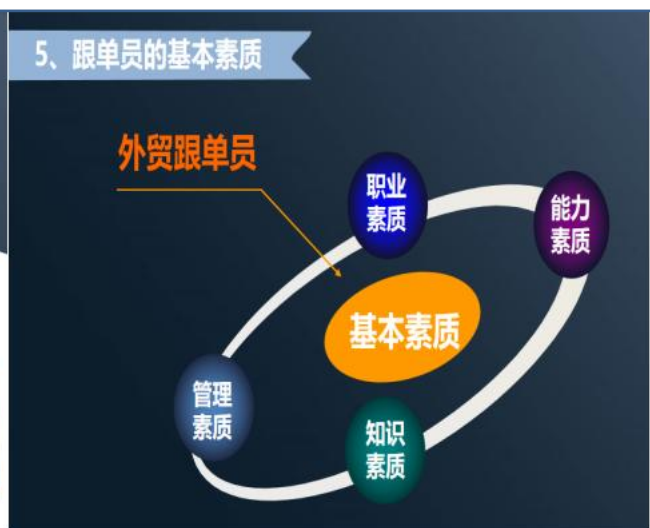
图 14 跟单员基本素质