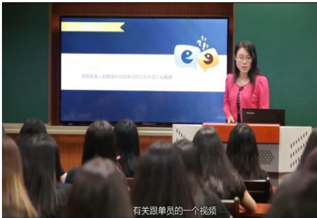
图 5 播放教学视频