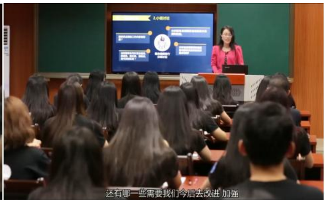
图 8 教师点评总结