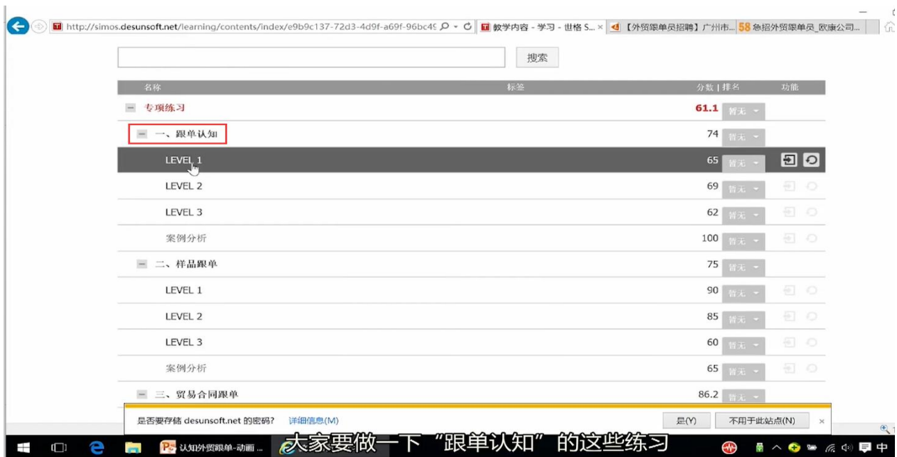
图 16 软件专项练习安排