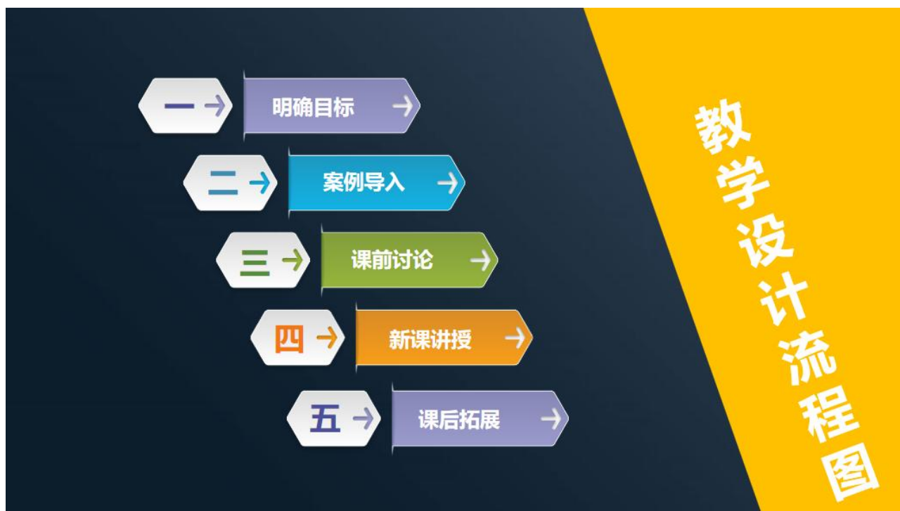
图 2 教学设计流程图