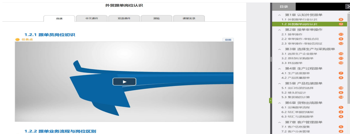
图 1 教师课前上传教学资源