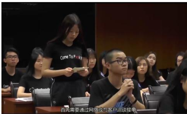
图 7 学生代表发言