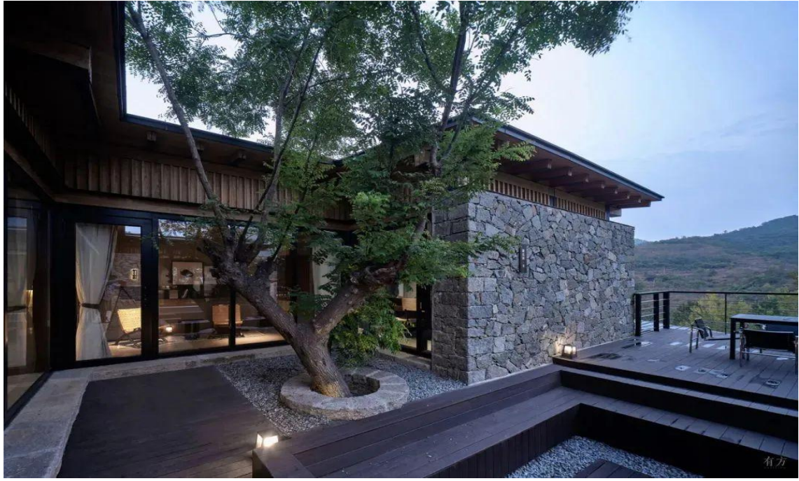
△ 八号院子