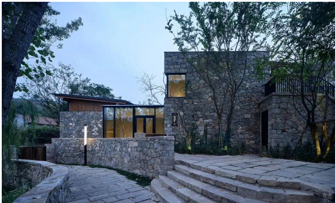
△ 一号院子

如何将存量宅基地及集体建设用地有效利用？如何为贫困村引流，产生经济效益，使其可持续发展？设计师提出双线并行的设计策略，一是做针灸式的改造，在保持宅基地边界不变的情况下，以存量建筑的空间激活和原有环境的生态修复为切入点，从而实现旧村落的新生；二是通过建立公共空间来激发可以引流的媒体效应。