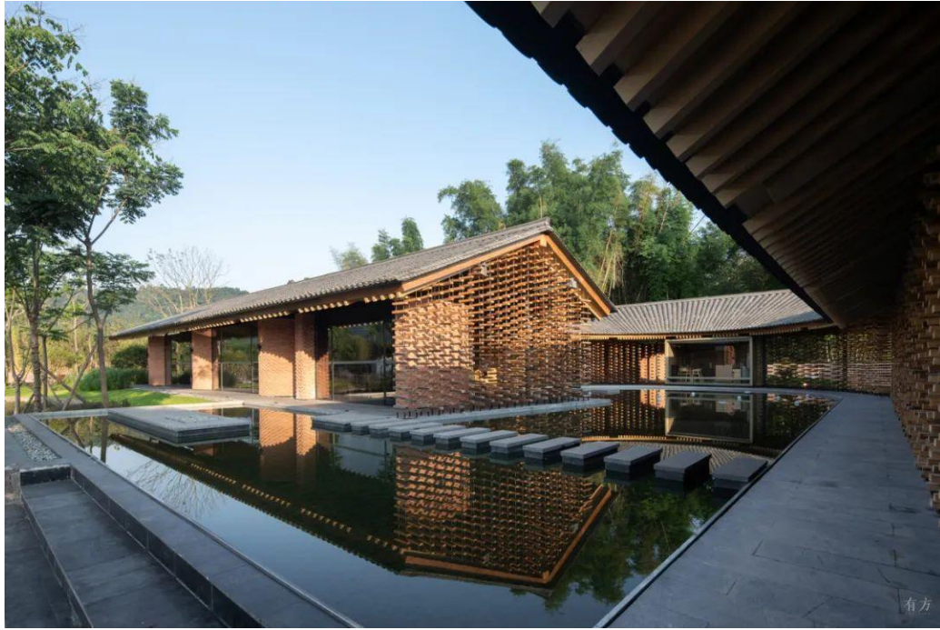
△ 外院与内院