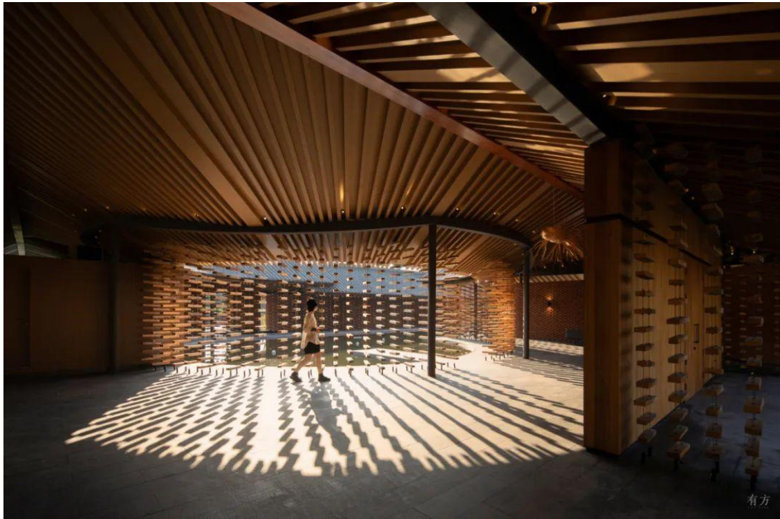
△ 内院的光影