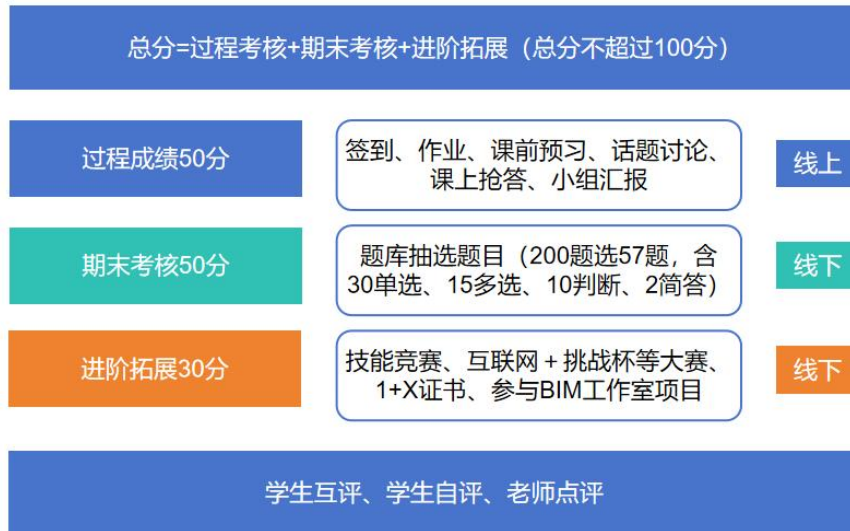
图 5. 课程考核方式