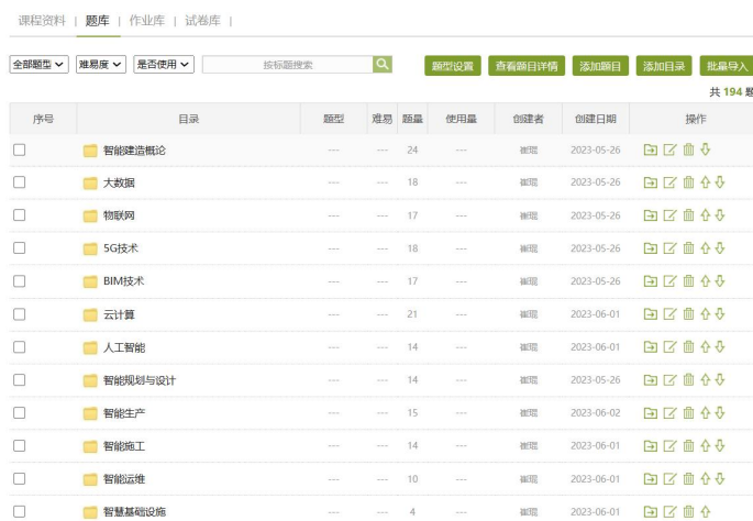
图 4. 线上作业题库

课后教师发布线上作业和拓展任务。作业包括基础知识和案例分析，其中基础知识包括专业名词、简答等。学生通过完成基础知识作业来检测对掌握知识目标的实现程度，通过案例分析培养运用基础知识问题的能力。拓展任务则需要学生以小组为单位，分工合作，设计并实施探究性学习过程，包括查阅和整合文献、撰写课程论文、创新设计试验方案，线下通过翻转课堂，以汇报、讨论、交流、教师答疑及总结点评的方式运作，帮助学生进行深度学习。同时利用教学平台等多种途径继续师生互动答疑，实现课堂结束而思考不止。最后教师通过平台的大数据分析学生线上的学习行为，掌握学生学习效果及薄弱环节，以便后续调整优化教学设计，提升教学效果。