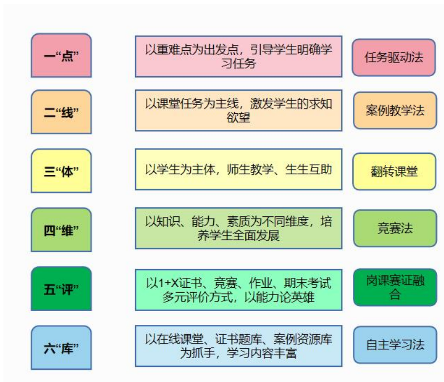
图 3. 教学方法图

如何在有限的课堂时间内帮助学生建立起相对完整的知识框架, 是线下课堂教学的重点。“人之进学在于思”, 根据学生线上预习的反馈情况、紧密章节, 结合知识点来构思和设计教学内容。将课堂教学进行分解, 找到多种适用于理论课的教学模式, 采用一点二线三体四维五评六库的教学方法实施教学。