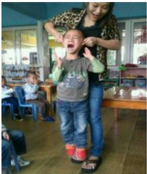
浙江温岭某幼儿园老师虐童事件