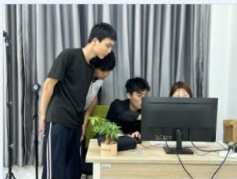
从化区职业技术学校学生学习直播后台运营知识