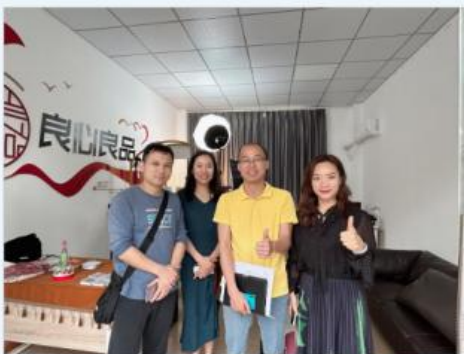
参观“校中厂”直播基地